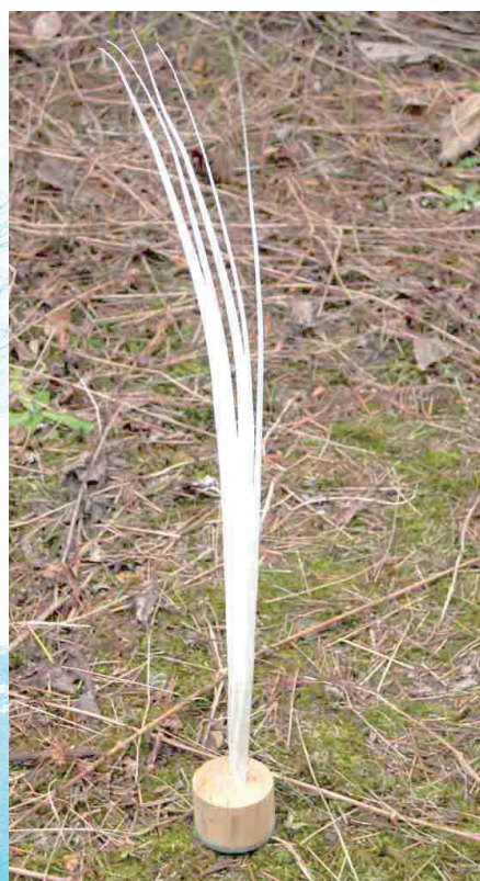
和名「気流苗・キリュウナエ」 英名「AIR MIRROR」 学名 Pentalbitenuiphylla japonica

白い5枚の細長い葉を持ち、気流部によって植え付けられる。通常は密な群落を形成し、風を映し込む鏡と称される。人の手によって、その群落は形を常にかえて行き、又、風のように移動し、水辺、湿原、乾燥地、アスファルトに限らず生育する。花は時として、二枚の白い花弁を空中に咲かせるという。