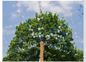
北アルプス山麓大凧プロジェクト 2018 「気流岳」～和凧作りワークショップや大凧曳き揚げイベントを開催。