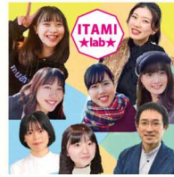
武庫川女子大学 建築・まちづくり研究室 (伊丹研究室)

①②③④の各地点でゲームをクリアすれば、スペシャルカードがもらえるよ！ すべてのカードを集めて、オリジナルの防災マイブックを完成させよう！