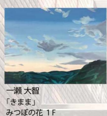
一瀬 大智 「きまま」 みつほの花 1F