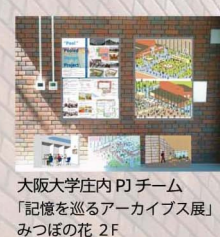
大阪大学庄内PJチーム 「記憶を巡るアーカイブ展」 みつほの花 2F

※上記のプログラムは随時参加出来ます。 ※建築模型は10月1日～31日の間、展示されます。