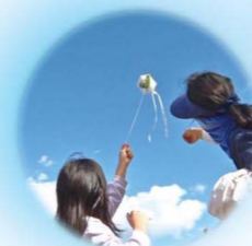
「大空高くみんなの願いを！2020」 ～新型コロナウイルスの終息を願う 全国一斉風船ダイブ / 2020年11月3日