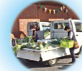
朝市～野菜即売会 / 2020年～