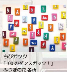
ちびガッツ 「100のダンスガッツ！」 みつほの花 各所