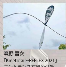
森野 晋次 「Kinetic air-REFLEX 2021」 エントランス右階段付近