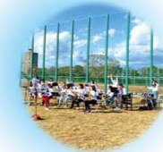
「COMOT！秋のミニライブ」/ 2020年11月3日 大阪産業大学ミュージックコミュニケーション専攻 学生有志