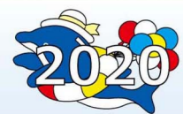
グリーンスポーツセンターキャラクター いるかのしょうちゃん

「Augmented Reality」の略で、日本語では「拡張現実」と呼ばれています。スマートフォンやARグラス越しで見ると、現実世界にナビゲーションや3Dデータ、動画などのデジタルコンテンツが出現し、現実世界に情報を付加する技術です。