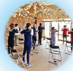
みつぼの花での体操教室