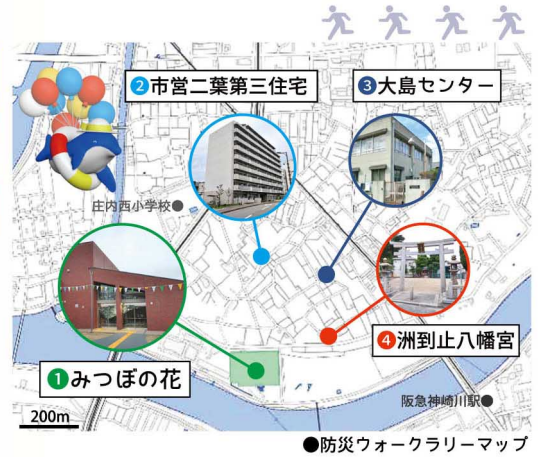
●防災ウォークラリーマップ