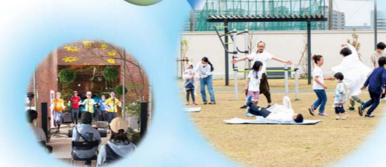
庄内つくるフェス / 2021年3月28日 主催・一般社団法人タチヨナ