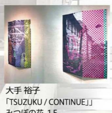
大手 裕子 「TSUZUKU / CONTINUE」 みつほの花 1F