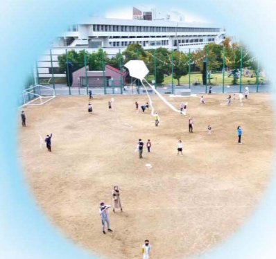
SHONAI COLORS / 2020年10月 四国大学・T-LAP