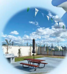
バーベキューコーナー