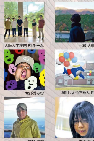
大阪大学庄内PJチーム