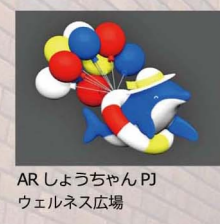
AR しょうちゃんPJ ウェルネス広場